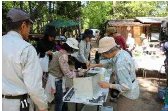
4月22日 収穫した山菜の天ぷら