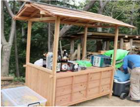
4月7日 ユガテの春を楽しむ（新調屋台）