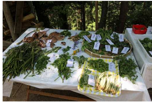
4月22日 エコツアー（採取した山菜の展示）