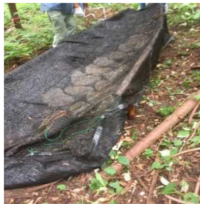
6月23日 ヒラタケの本伏せ作業