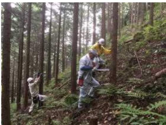
6月23日 間伐予定木の選木作業風景