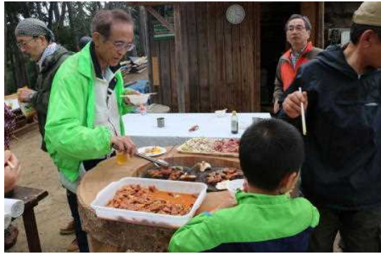
4月7日 ユガテの春を楽しむ（ホルモン焼き）