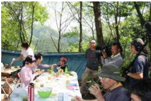
4月22日 NHKによる撮影風景