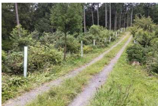
9月25日 植林完了 シカの食害防止柵設置