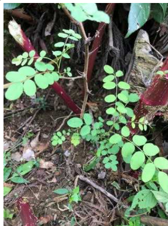
8月29日 定例活動 下刈り