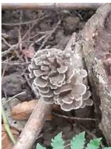
9月25日 マイタケ発生 (ユガテ)