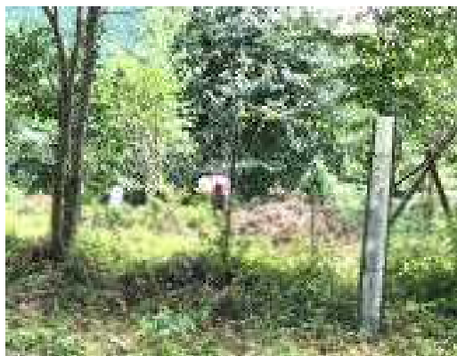
7月25日 定例活動 萩内の下刈り