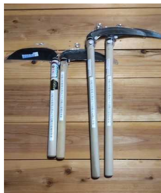
植林作業のための鎌を購入