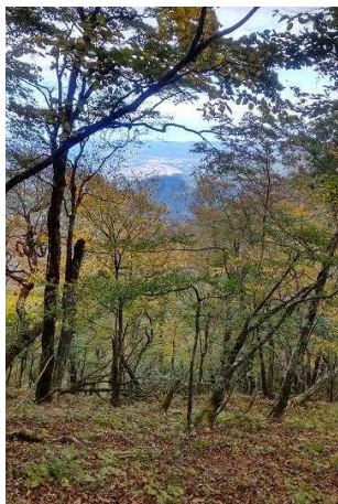
遠く、秩父市内を望む

10月上旬、秩父市の浦山国有林内の天目山林道を利用させていただき、東京都境の七跳山（ななはねやま）1651mに行きました。紅葉の盛りには、10日前後早いようでした。かって、笹一面の林床が60年に1度(?)に起こる笹枯れとなり、一面にカエデの幼樹が生えていました。