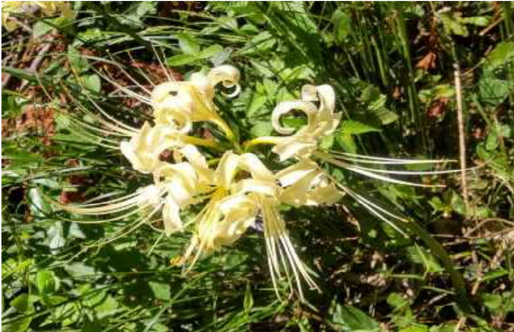
白花曼珠沙華 ユガテ（令和3年9月19日撮影）

発行 NPO法人 西川木楽会 埼玉県飯能市大字飯能291番地 2021年10月1日