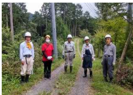
9月25日 定例活動 植林作業