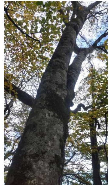
ブナ (イヌブナ、ブナが混在)