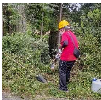
9月25日ボランティアが活躍