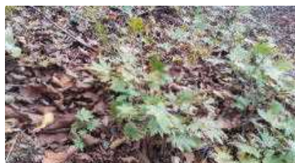
林床一面にコハウチワカエデ