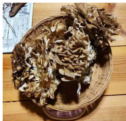
10月2日 収穫 500g